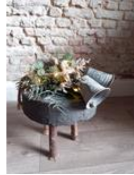
K81 Kerstskrukje €25,-