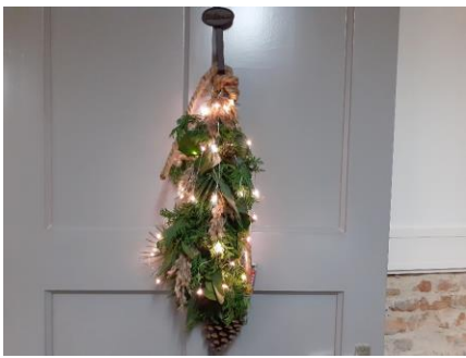
K84 Toef deurhanger kan met of zonder lampjes €22,50