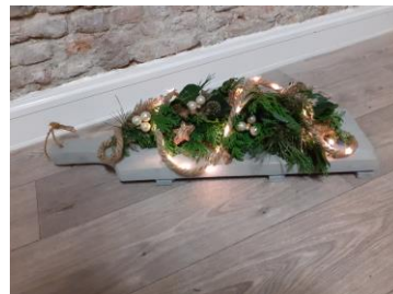
K86 Kerst op snijplank €27,-