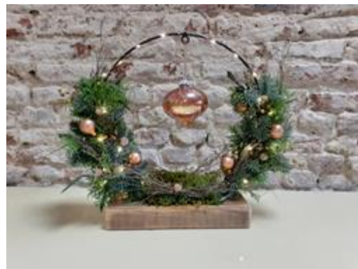
K80 Kerst doorkijk . De cirkel is voor de helft met kerst groen opgemaakt. Kan in andere kleurstelling gemaakt worden. €26,-