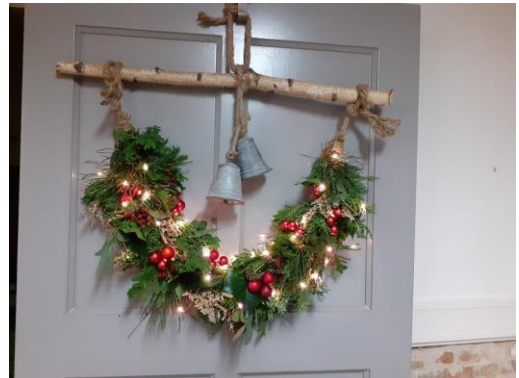
K82 Guirlande op stok . Kan in andere kleurstelling gemaakt worden €32,-

Weer eens wat anders de Winterstok. Geheel in eigen kleur te maken met of zonder verlichting . Heel leuk om s' avonds bij de deur te hebben staan en makkelijk te verplaatsten. €20,-